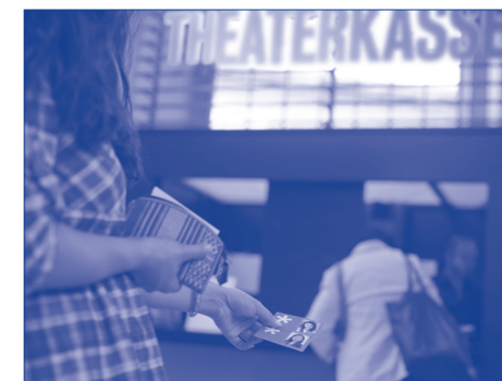
Eintritt dank KulturLegi

In unserer Gesellschaft gehört es dazu, sich etwas leisten zu können. Wer seine Freunde trifft, tut dies meist bei einem guten Essen daheim oder im Restaurant, geht mit ihnen ins Kino oder macht gemeinsam Sport. Genau das liegt kaum drin, wenn man zu den armutsgefährdeten Menschen gehört. Viele schämen sich für ihre Situation und haben Angst, die Anerkennung ihrer Freunde zu ver-